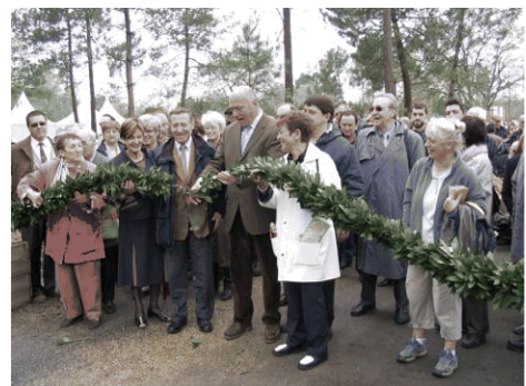
Inauguration du 23 avril 2005

Présentation de cours à la salle Bellegrave le 18 juin 2005 en matinée à 15h00 et en soirée à 20h30.