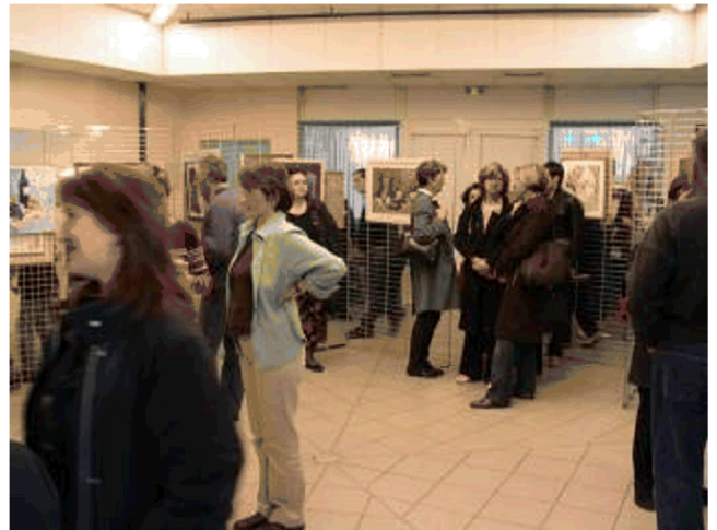
Une vue du public

La rencontre magontine du 16 avril 2005 était vouée aux arts plastiques sous le thème La gourmandise sous le pinceau avec la participation très active de Carré d'Arts.